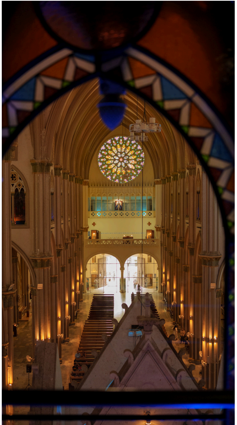
SONY A7CII Y EL VILTROX 40MM

LA JOYA DE LA CORONA ES LA CATEDRAL METROPOLITANA DE SAN PEDRO, UBICADA FRENTE AL EMBLEMÁTICO PARQUE SEMINARIO.