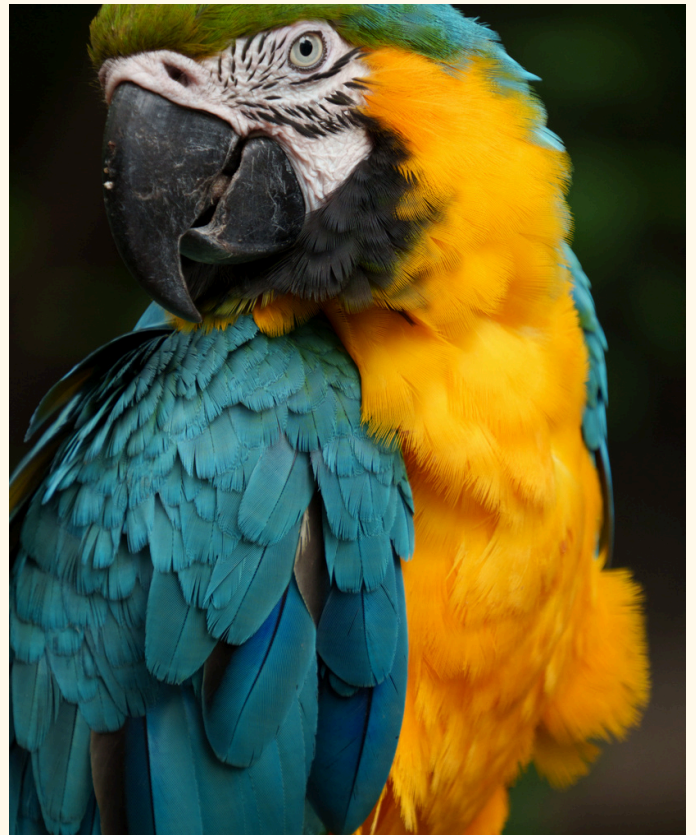
Guayaquil: un museo a cielo abierto tallado en monumentos y consagrado como el nuevo gigante turístico del Pacífico.