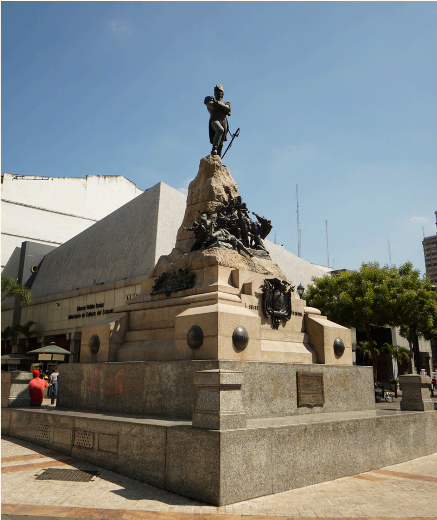
POR DAVID ORTEGA M