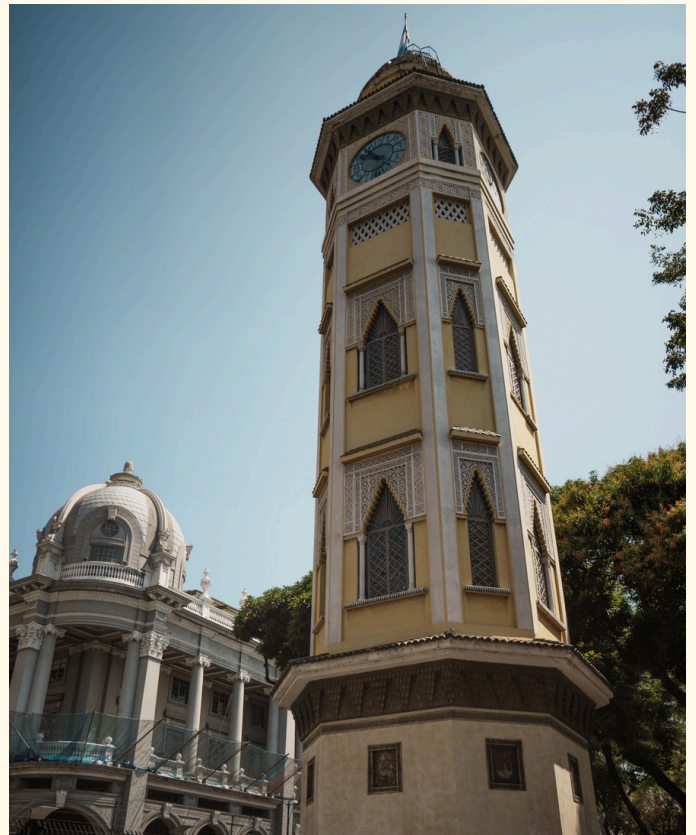
De la piedra a la vanguardia: Guayaquil consolida su historia en imponentes monumentos y se alza como una potencia turística ineludible.