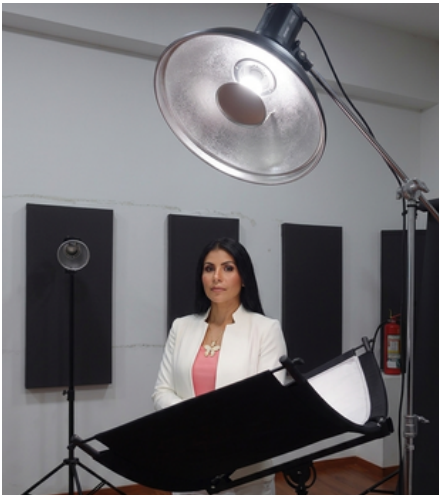
Un beauty dish y un reflector