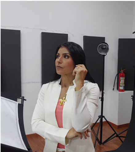
Talento ubicado bien cerca de la luz