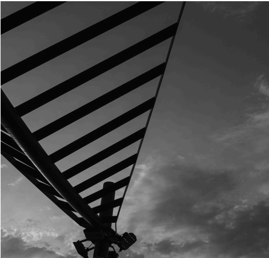
Lente de Kit 18-55