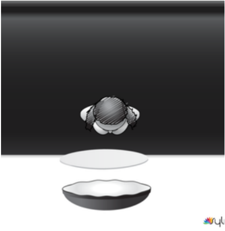
Esquema desde arriba