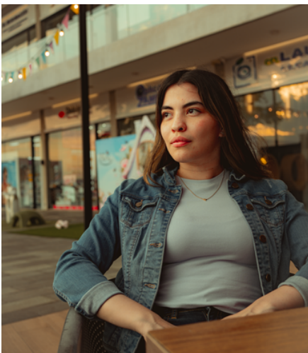
Sigma 35mm F1.8