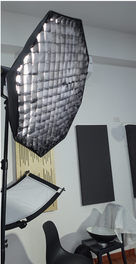
Creando el esquema de luz

En esta edición, quisimos llevarte con nosotros al campo de batalla.