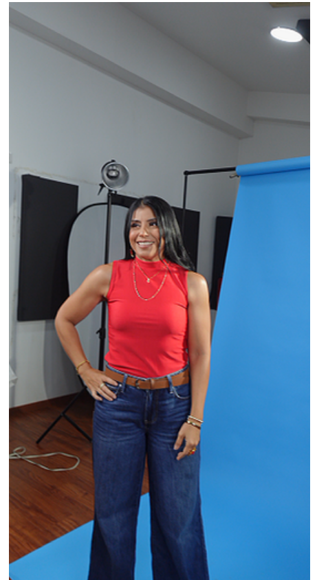
Desarrollando la idea