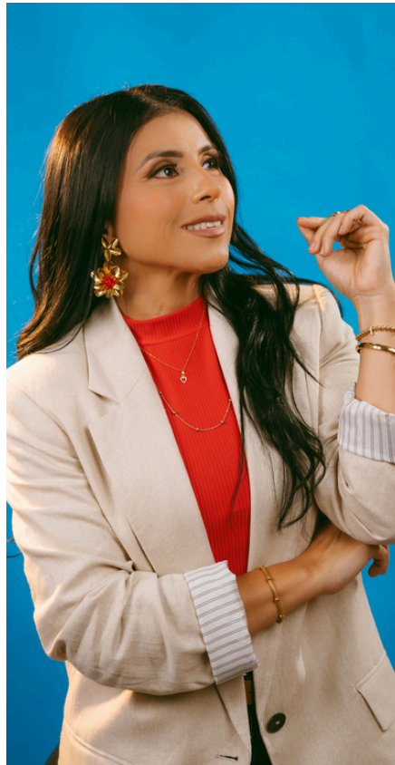
Ayudando al talento a posar