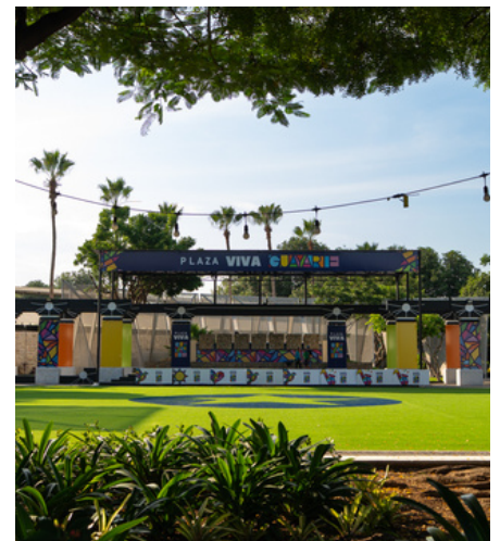
Sony 16mm F2.8